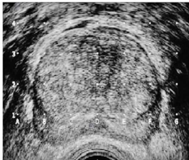
Figura 1 Mayo Foundation for medical education and reserch.