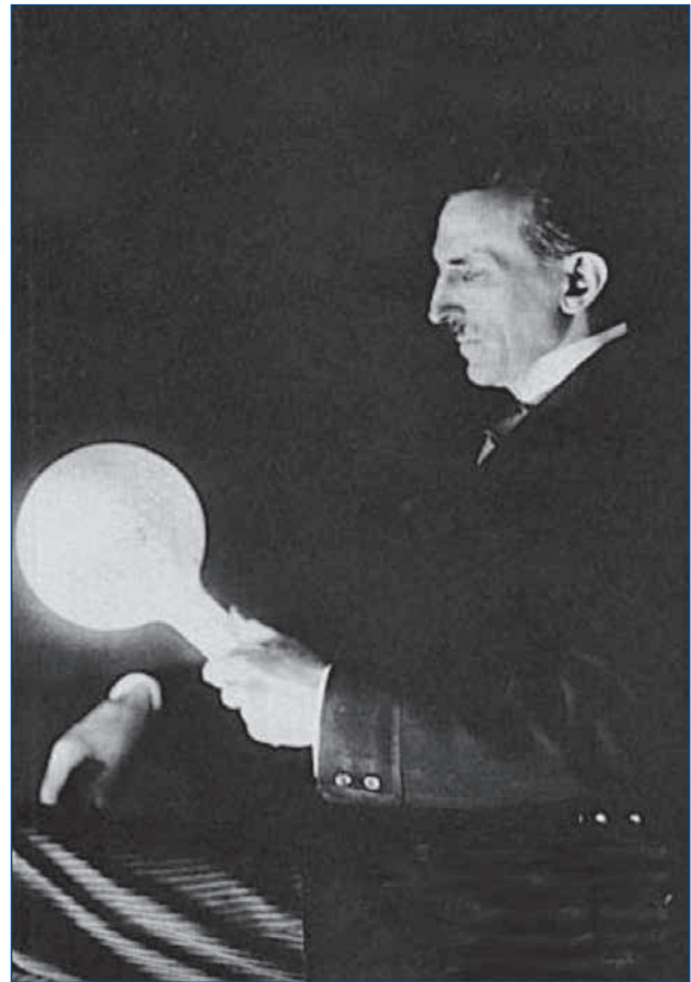
Figura 2. Tesla usa su propio cuerpo como conductor eléctrico de una ampollita.

En una oportunidad en su laboratorio en Manhattan, Nueva York, y debido a sus experimentos, provocó conscientemente una pseudo explosión. Su idea era remecer los edificios aledaños a la semejanza de un terremoto, pero con la precaución de no provocar daño (3).